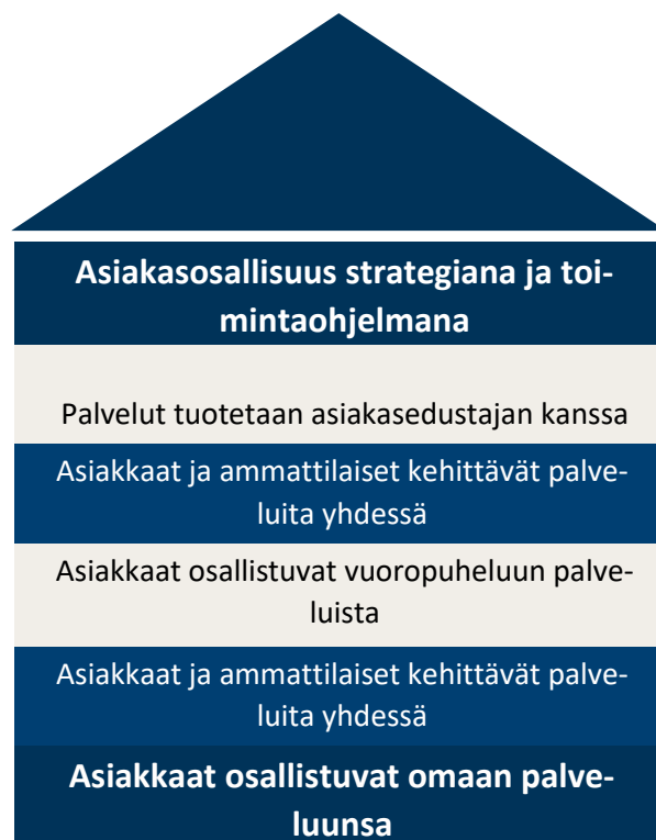
KUVA 1 ASIAKASOSALLISUUDEN TALO (THL 2020)