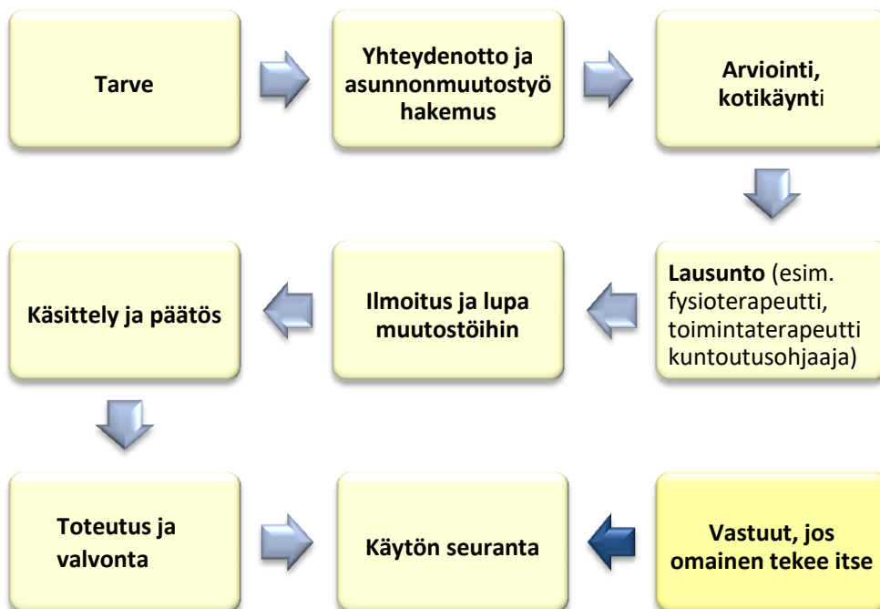
Kuva 2. Asunnonmuutostyöprosessi

Yhteydenotto apuvälinekeskuksen- tai vammaispalvelun sosiaalityöntekijään/sosiaaliohjaajaan/palveluohjaajaan suullisesti tai kirjallisesti. Jos hakemus tehdään suullisesti, pyydetään tarvittaessa täyttämään myös kirjallinen hakemus ja toimittamaan tarvittavat liitteet Apuvälinekeskukseen tai vammaispalveluihin. Hakemuksen perusteella sovitaan arvioinnista/kotikäynnistä ja siitä, ketkä siihen osallistuvat.