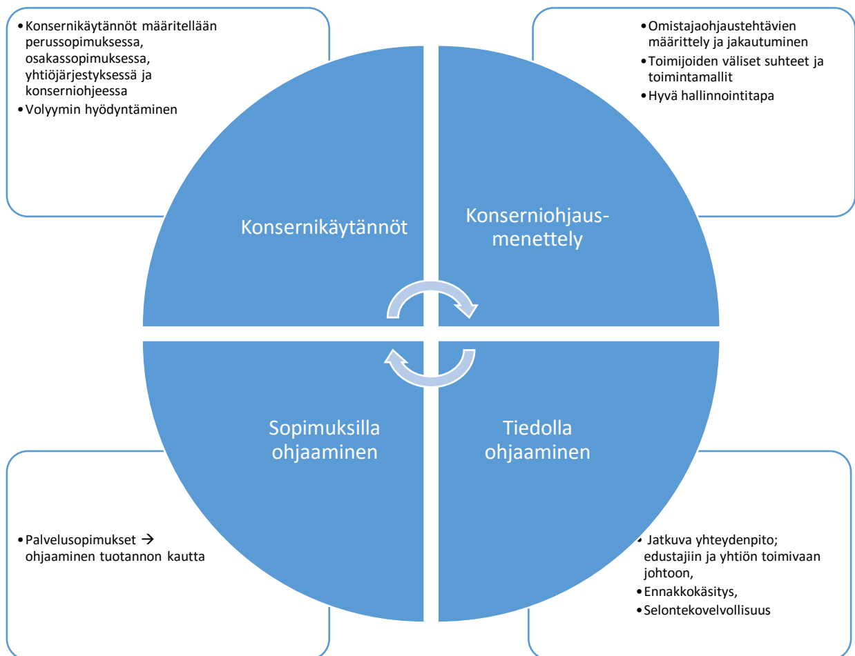
Kuva 1 Konserniohjauksen keinot

Konserniohjeella luodaan myös puitteet konserniin kuuluvien yhteisöjen omistajaohjaukselle tavoitteiden mukaisesti.