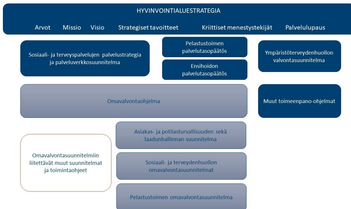
KUVIO 3. OMAVALVONTAOHJELMAN SIIJOITTUMINEN Pohjois-Karjalan Hyvinvointialuestrategiakokonaisuuteen